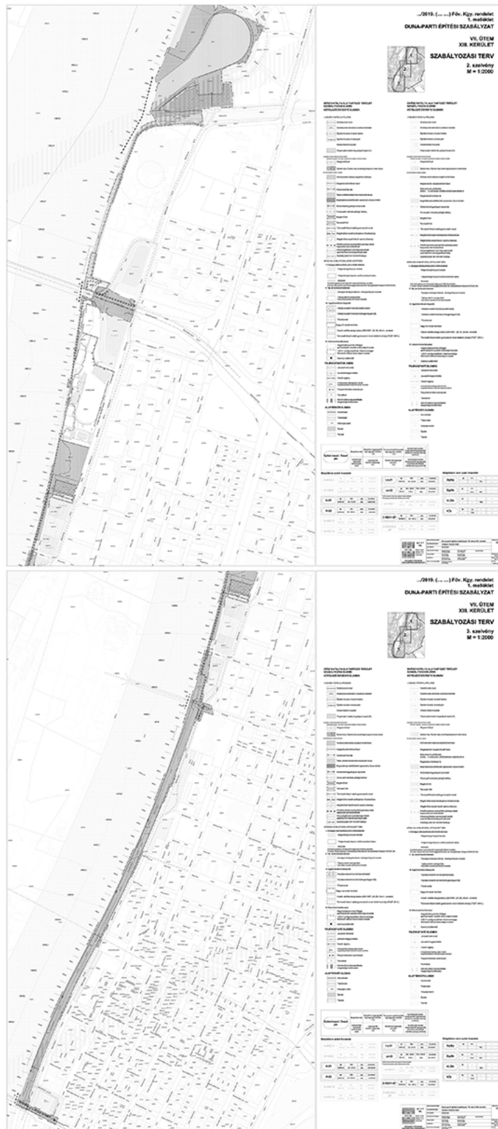
2. melléklet a 36/2018. (X. 30.) Főv. Kgy. rendelethez